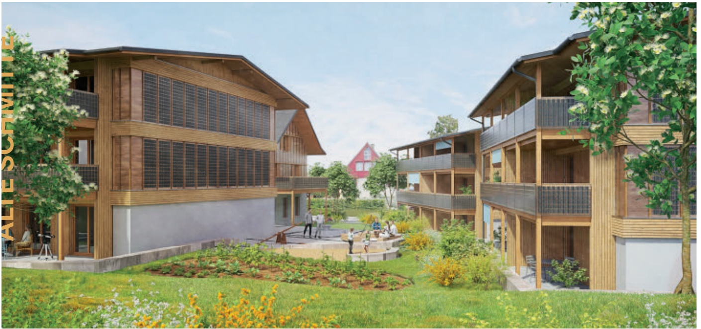
Die 27 Mietwohnungen werden Ende 2024 bezugsbereit sein.