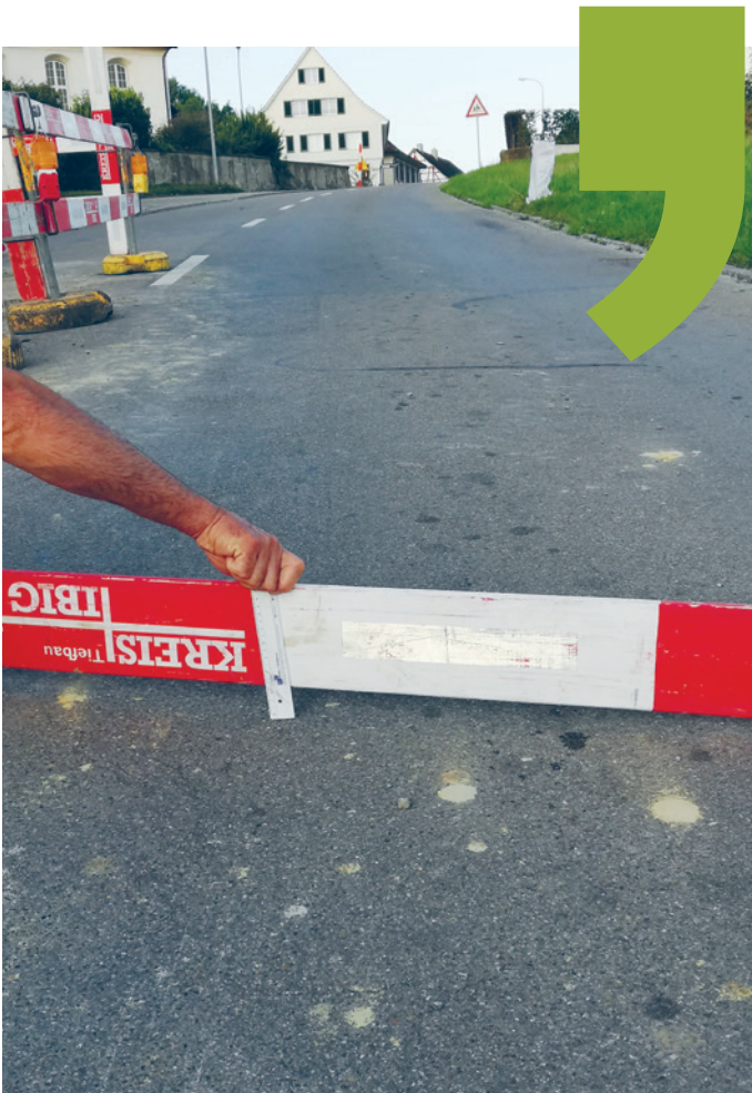
Der Leitungsbruch führte zu einer Belagssenkung von bis zu 4 cm.