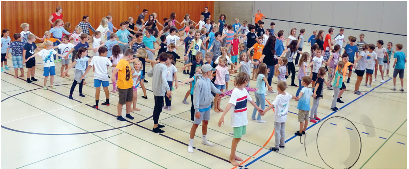
Am Labyrinth-Spiel bei der Auflösung des Ballonflugwettbewerbs hatten alle sehr viel Spass.