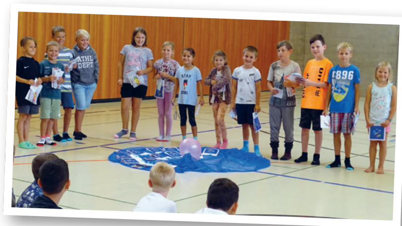
Die glücklichen Gewinner erhielten ein kleines Geschenk.