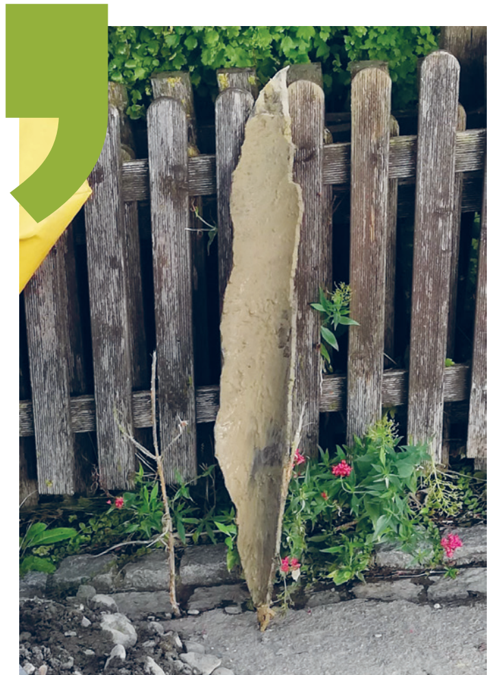
Das herausgebrochene Rohrstück der beschädigten Wasserleitung.